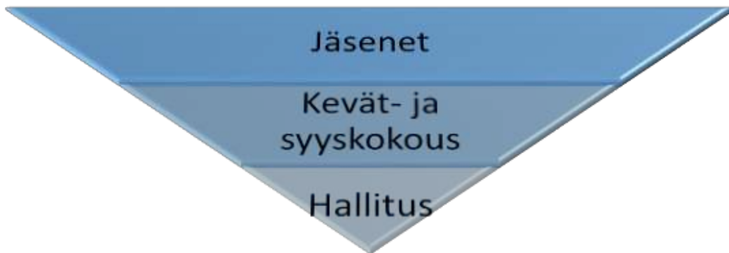
Kuva 1. Päätösvalta yhdistyksessä.

Seuran jäsenillä on ylin päätösvalta. Jäsenet pystyvät käyttämään tätä päätösvaltaansa seuran yleiskokouksissa, eli kevät- ja syyskokouksissa. Syyskokous valitsee hallituksen ja määrittää toimintasuunnitelman ja talousarvion, joita hallitus toteuttaa. Kevätkokouksessa hyväksytään edellisen toimintavuoden toimintakertomus ja tilinpäätös sekä annetaan hallitukselle vastuuvapaus. Jokaisella jäsenellä on ääni- ja puheoikeus yleiskokouksissa.